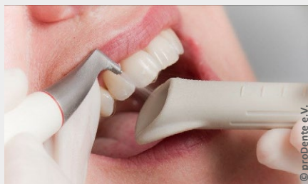
Zahnreinigung mit Pulverstrahler

Auch wer seine Zähne regelmäßig und sorgfältig putzt, erreicht nicht alle Zahnoberflächen. Das sind vor allem die Stellen unter dem Zahnfleisch, in manchen Zahnzwischenräumen und die sehr feinen Grübchen auf den Kauflächen.