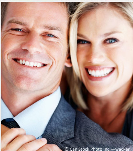
Selbstsicher mit gepflegten Zähnen

Dann werden Mund, Zähne und Zahnfleisch untersucht. Die Zahnbeläge werden angefärbt, um sie besser sichtbar zu machen und es wird die Tiefe der Zahnfleischtaschen gemessen.