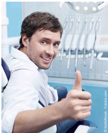
Gesunde Zähne in jedem Lebensalter dank regelmäßiger Professioneller Zahnreinigung